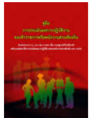
หนังสือ การประเมินผลการปฏิบัติงาน ของข้าราชการหรือพนักงานส่วนท้องถิ่น