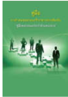
หนังสือ สมรรถนะประจำตำแหน่งงาน