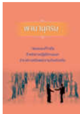
หนังสือ สมรรถนะที่จำเป็นสำหรับการปฏิบัติงานของ ข้าราชการหรือพนักงานส่วนท้องถิ่น