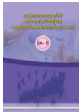
หนังสือ รวมประกาศมาตรฐานทั่วไป หลักเกณฑ์ หนังสือสั่งการ การบริหารงานบุคคลส่วนท้องถิ่น