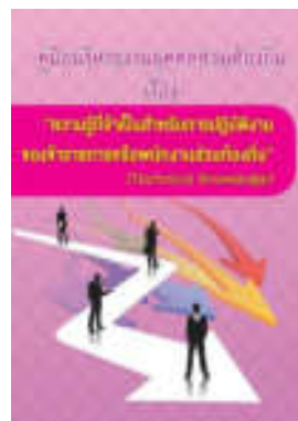
หนังสือ ความรู้ที่จำเป็นสำหรับการปฏิบัติงาน ของข้าราชการหรือพนักงานส่วนท้องถิ่น