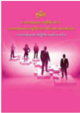
หนังสือ การประเมินผลการปฏิบัติงานพนักงานจ้าง