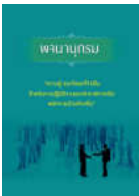
หนังสือ ความรู้ และทักษะที่จำเป็น สำหรับการปฏิบัติ งานของข้าราชการหรือพนักงานส่วนท้องถิ่น