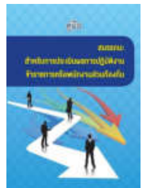
หนังสือ สมรรถนะสำหรับการประเมินผลการปฏิบัติงาน ข้าราชการหรือพนักงานส่วนท้องถิ่น