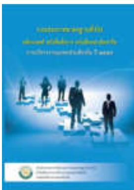
หนังสือ หลักเกณฑ์ หนังสือสั่งการ หนังสือตอบข้อหารือ การบริหารงานบุคคลส่วนท้องถิ่น ปี ๒๕๕๗