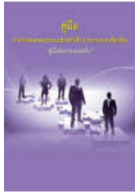
หนังสือ สมรรถนะหลัก