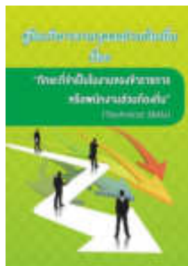
หนังสือ ทักษะที่จำเป็นในงานของข้าราชการ หรือพนักงานส่วนท้องถิ่น