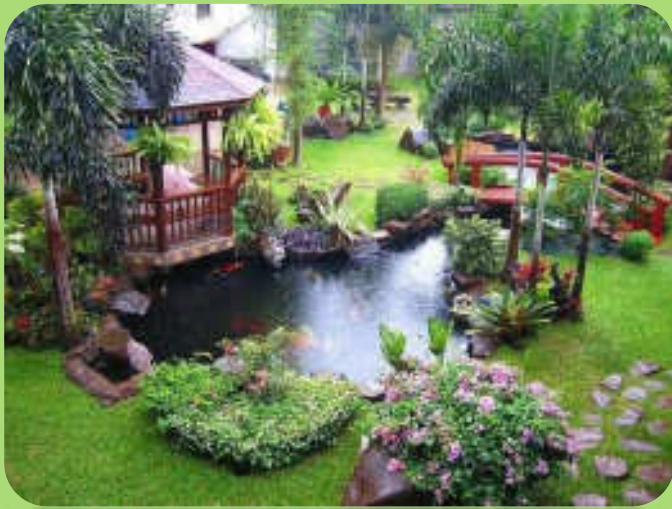
สวนหย่อม