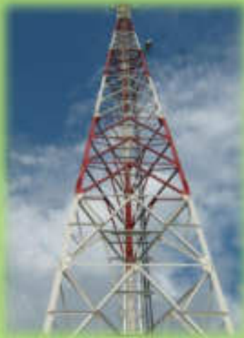
เสาส่งสัญญาณอินเทอร์เน็ต