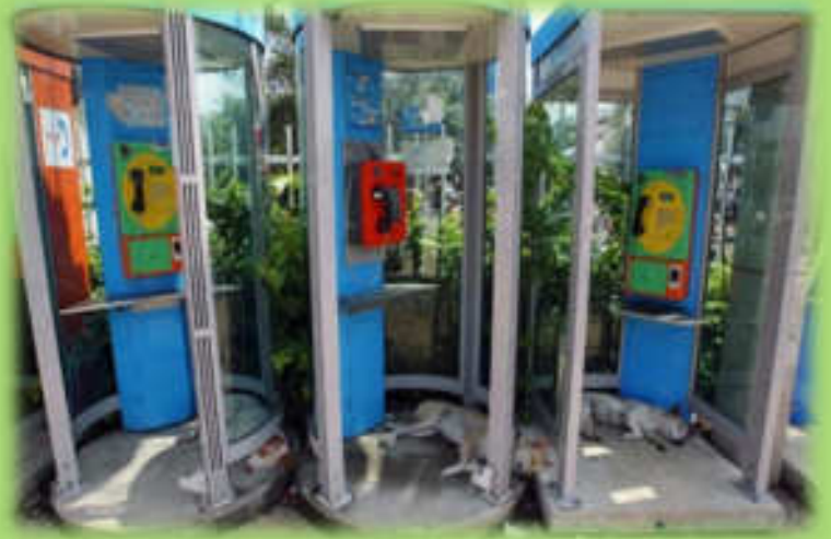
ตู้โทรศัพท์สาธารณะ