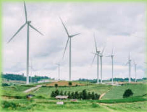
กังหันลม