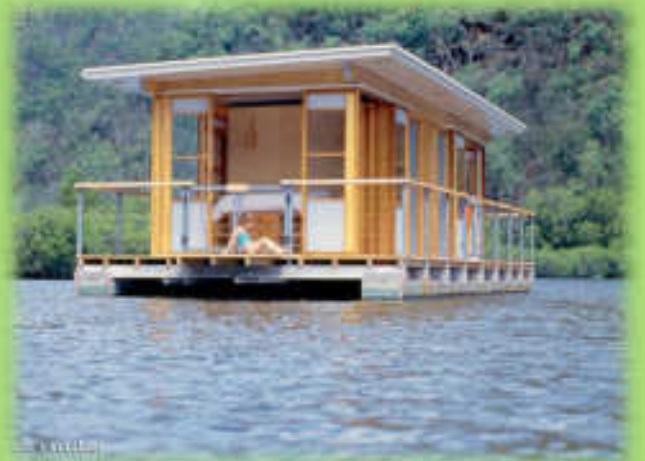
บ้านเรือนแพ