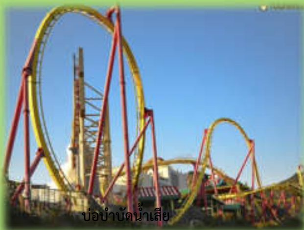
บ่อบำบัดน้ำเสีย