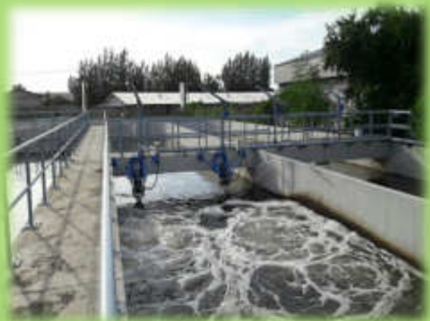
บ่อบำบัดน้ำเสีย