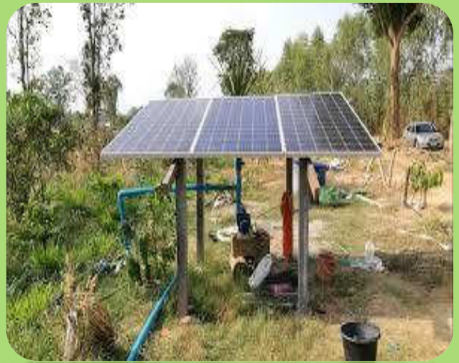
แผงโซลาเซลล์