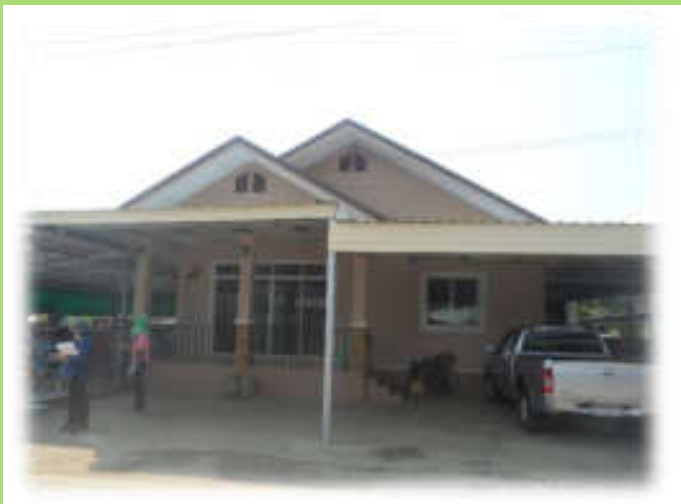
บ้านเดี่ยว

ตัวอย่างสิ่งปลูกสร้างที่อยู่ในข่ายต้องเสียภาษี