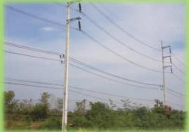
เสาไฟฟ้า