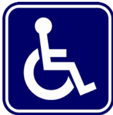
สัญลักษณ์ผู้พิการ