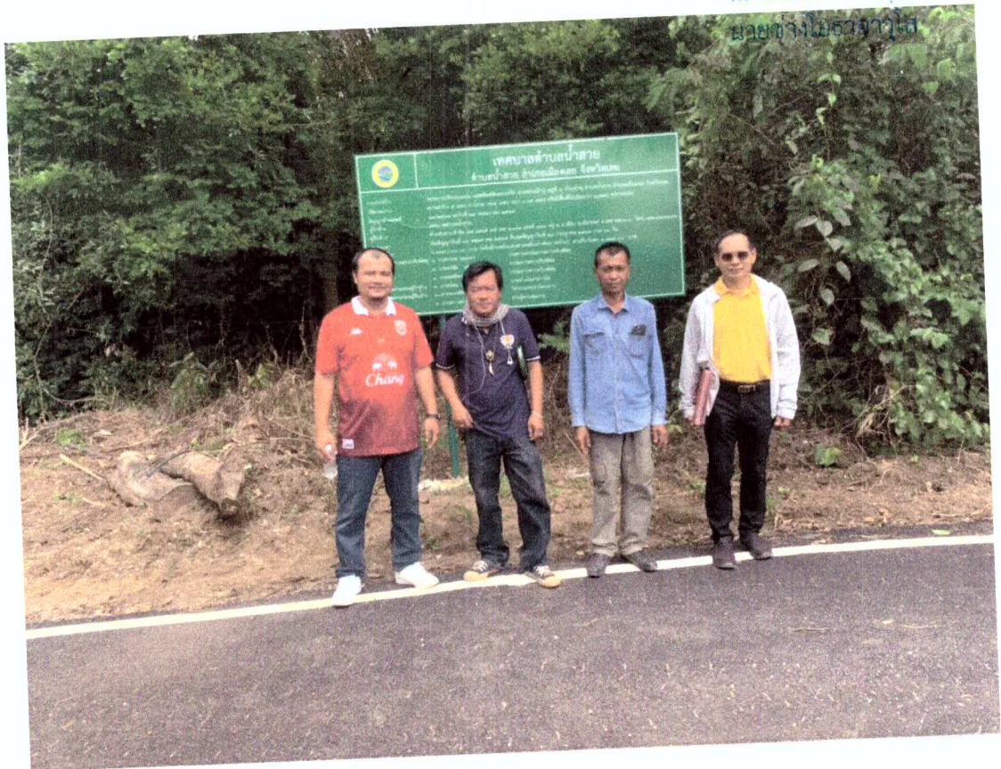
ฝ่ายช่างไม้ธนากร ๒

(เจ้าหน้า) ..... ประธานกรรมการ ฯ ( ) ..... กรรมการ ฯ (เจ้าหน้า) ..... กรรมการ ฯ (เจ้าหน้า) ..... กรรมการ ฯ (เจ้าหน้า) ..... กรรมการ ฯ